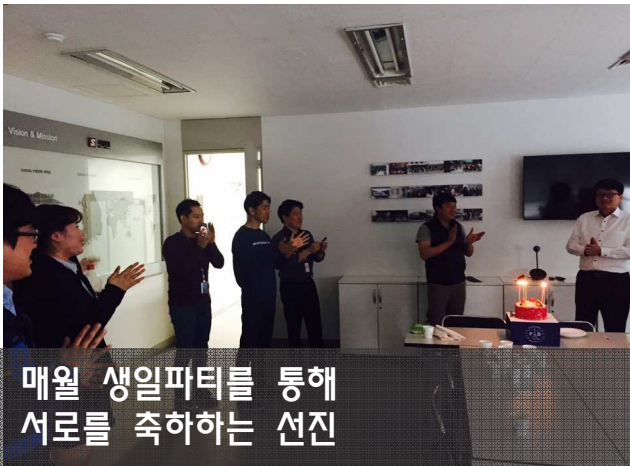
매월 생일파티를 통해 서로를 축하하는 선진