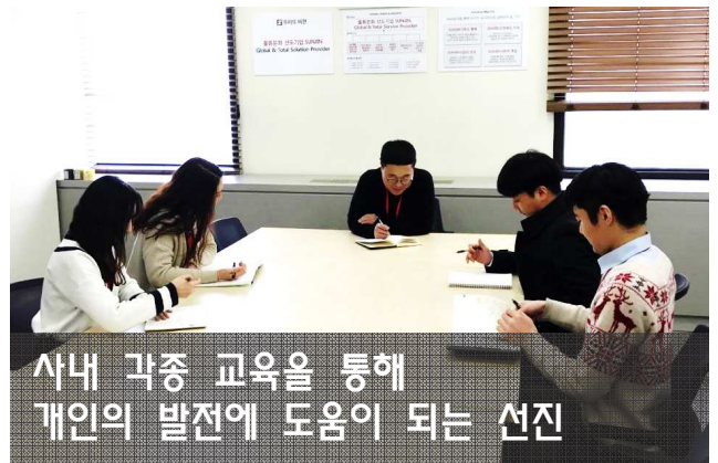
사내 각종 교육을 통해 개인의 발전에 도움이 되는 선진