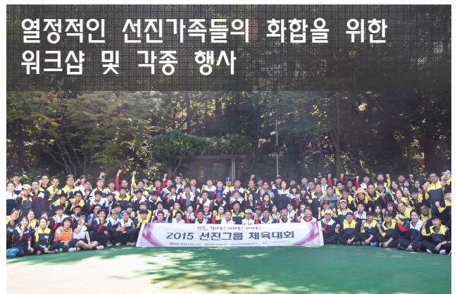
열정적인 선진가족들의 화합을 위한 워크샵 및 각종 행사